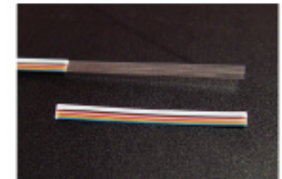
리본 파이버 스트립